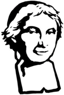
Saint Bénilde, priez pour nous