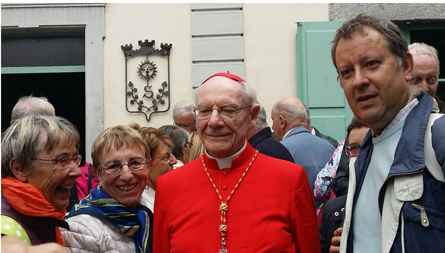
Cardinal Paul POUPARD (entouré de quelques fidèles de La paroisse de Thuret)