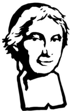
Saint Bénilde, priez pour nous