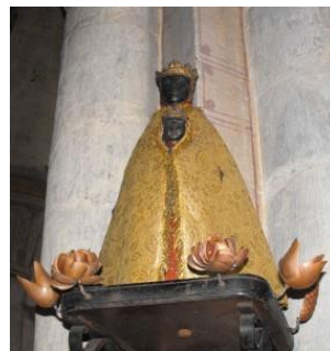
Vierge noire de Thuret devant laquelle Pierre Romançon (saint Bénilde) pria

"chrétiennes" : il prend un soin tout particulier des personnes fragiles, des malades, afin de faire passer dans leur vie la présence guérissante de Dieu. Confions-lui nos malades ! Il les conduira vers le Christ, médecin des âmes et des corps !